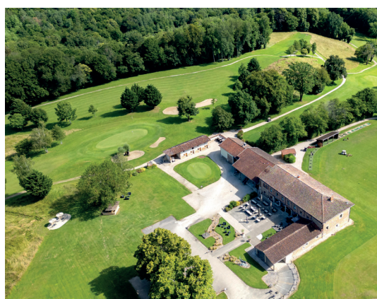
Le bâtiment central abrite le club-house et l'hôtel.

« Même si l'école de golf ne réunit pour l'instant qu'une vingtaine de jeunes, mon ambition à long terme est d'insuffler une véritable dynamique sportive au club. »